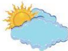
sol e nuvens