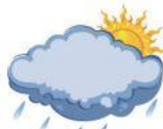
sol e chuva